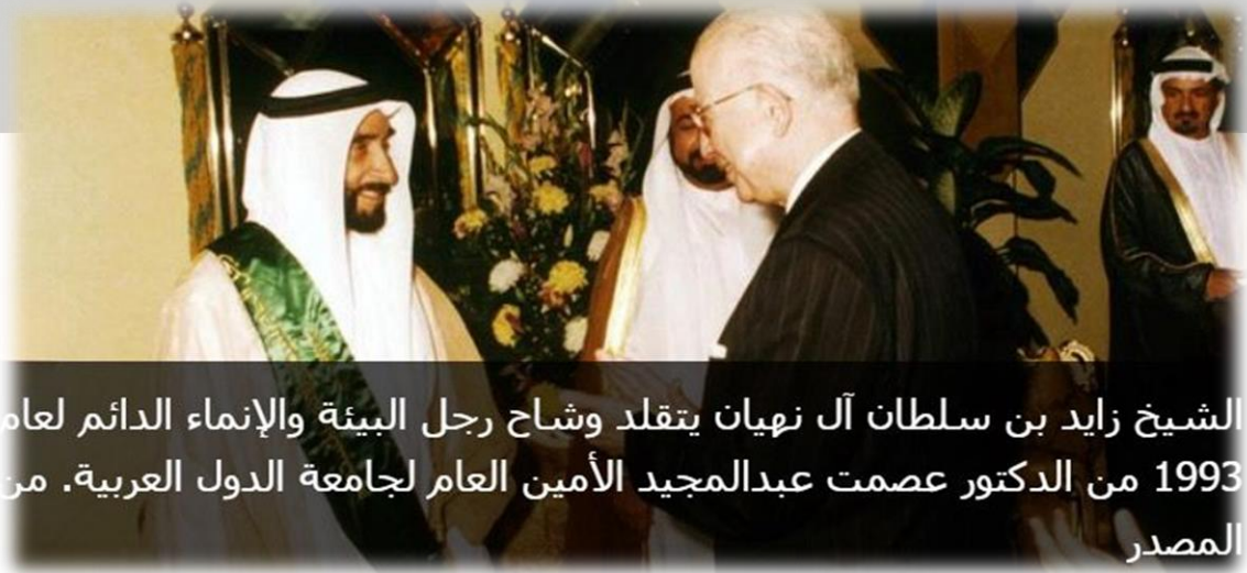
الشيخ زايد بن سلطان آل نهيان يتقلد وشاح رجل البيئة والإنماء الدائم لعام 1993 من الدكتور عصمت عبدالمجيد الأمين العام لجامعة الدول العربية.

تقديراً لأعمال المغفور له الشيخ زايد، الإنسانية والخيرية؛ حصل على العديد من الأوسمة والجوائز التكريمية والتقديرية على مستوى العالم، ومن هذه الجوائز والأوسمة: الوثيقة الذهبية من المنظمة الدولية للأجانب في جنيف، بوصفه أهم شخصية في عام 1985. ولدوره البارز في المجالات الإنسانية والحضارية، وفي عام 1998 اختير أبرز شخصية عالمية من قبل هيئة رجل العام الفرنسية لجهوده في مكافحة التصحر والاهتمام بالبيئة والمشروعات الإنمائية المختلفة. كما اختير الشيخ زايد، طيب الله ثراه، شخصية عام 1999 الإسلامية، من قبل المسؤولين عن جائزة دبي الدولية للقرآن الكريم؛ لما يوليه من رعاية كبيرة لبرنامج الرعاية الاجتماعية والإنسانية، ولما يقدمه من دعم للتعاون الإسلامي في كل الميادين، وإنشائه برامج المشروعات الخاصة، وبرامج الأنشطة الإسلامية الخيرية والثقافية والتعليمية، وتقديم المساعدات لمتضرري الكوارث.